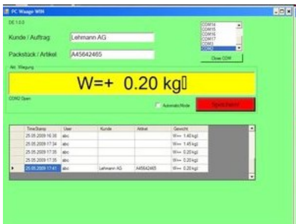
Screenshot PC Programm

Für Ihre Wiegedaten: Erfassen Sie Ihre Wiegedaten am PC, verbinden Sie diese mit weiteren Auftragsdaten (z.B. Kunde und Packstück) und speichern diese im XML / Excel XLS / CSV Datenformat.