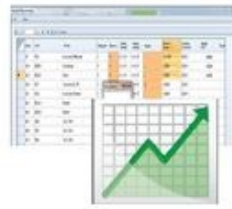
Bestands Check u. Mindestmengen