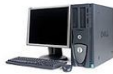
Lite XML Version