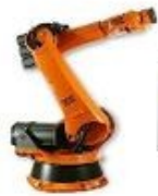
Schnittstellen für Kran, Maschinen, SPS und Regalsysteme